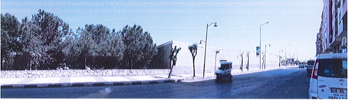
646 ada 6 parselden görünüm