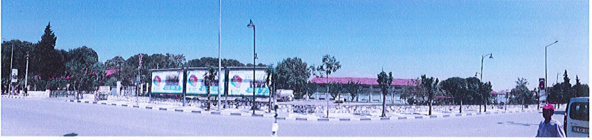
646 ada 6 parselden görünüm

646 ada 1-2-6 numaralı taşınmazlar S.S. Tariş Pamuk ve Yağlı Tohumlar Tarım Satış Kooperatifleri Birliğine bağlı 118 numaralı Manisa Pamuk Tarım Satış Kooperatifine ait olup içerisinde depolar ve idari yapılar yer almaktadır.