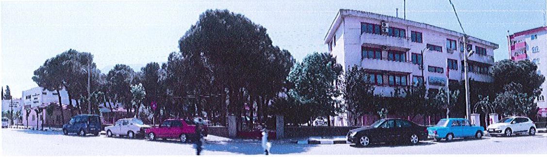
808 ada 35 parselden görünüm