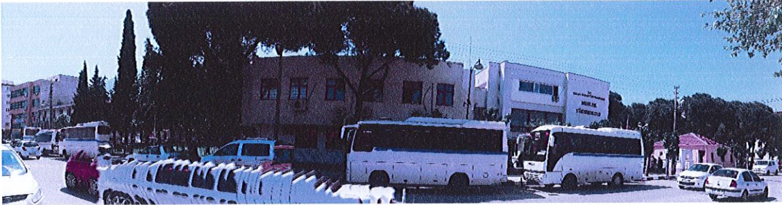
808 ada 35 parselden görünüm