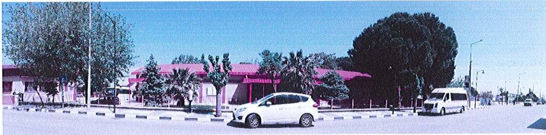
808 ada 31 parselden görünüm