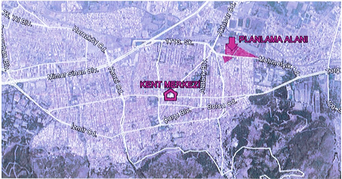
Planlama Alanının Kent İçindeki Konumu

Plan değişikliğine konu olan taşınmazlar Manisa İli, Şehzadeler İlçesi, Şehitler Mahallesi sınırları içerisinde bulunmaktadır. Kent merkezinin kuzeydoğusunda yer alan taşınmazlardan 808 ada 31 parsel ve 646 ada 1-2-6 parsellerin bulunduğu bölgenin güneyinde Mehmetçik Caddesi, kuzeyinde demiryolu, doğusunda 300. Sokak, batısında 700. Sokak bulunmaktadır. 808 ada 35 numaralı parseli ise kuzeyde Mehmetçik Caddesi, doğuda ve güneyde 719.sokak, batıda 702. Sokak çevrelemektedir.