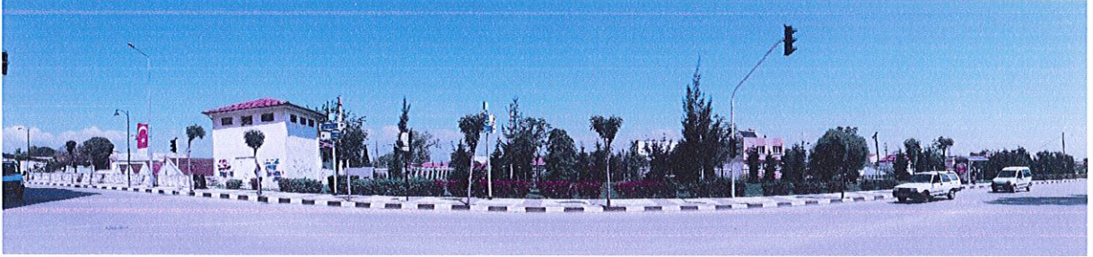
646 ada 2 parselden görünüm