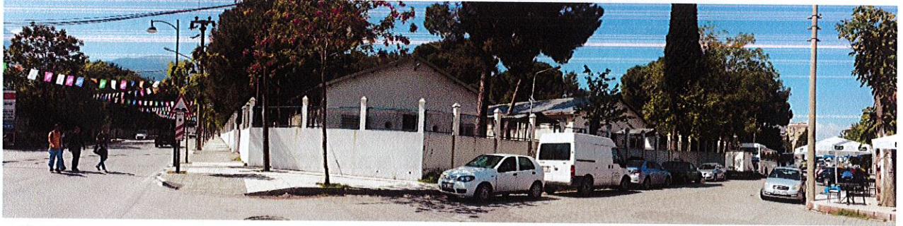
1521 sokaktan alanın görünümü