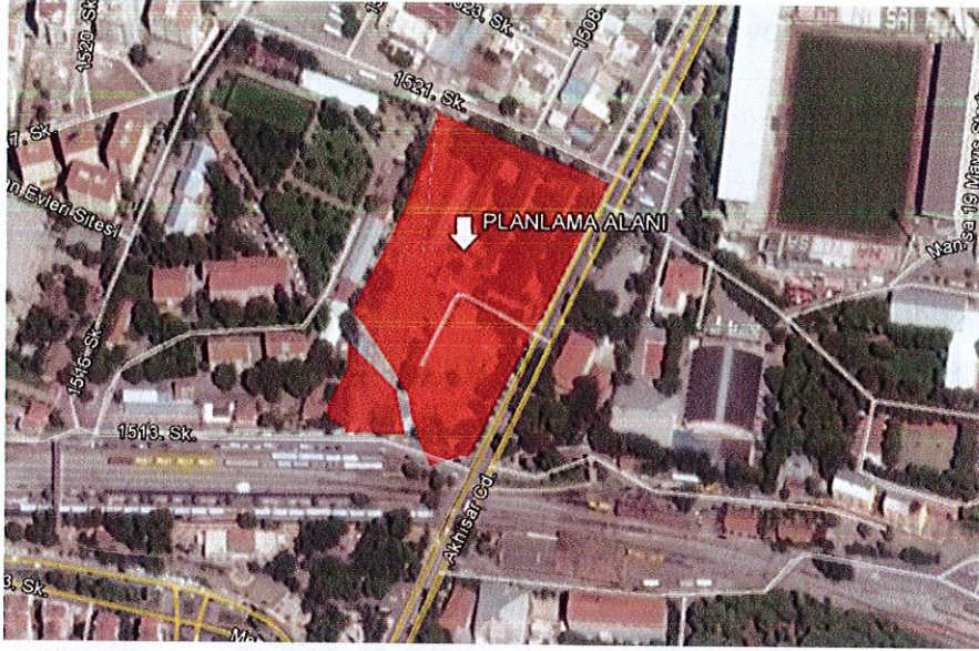
Planlama Alanı ve Yakın Çevresi