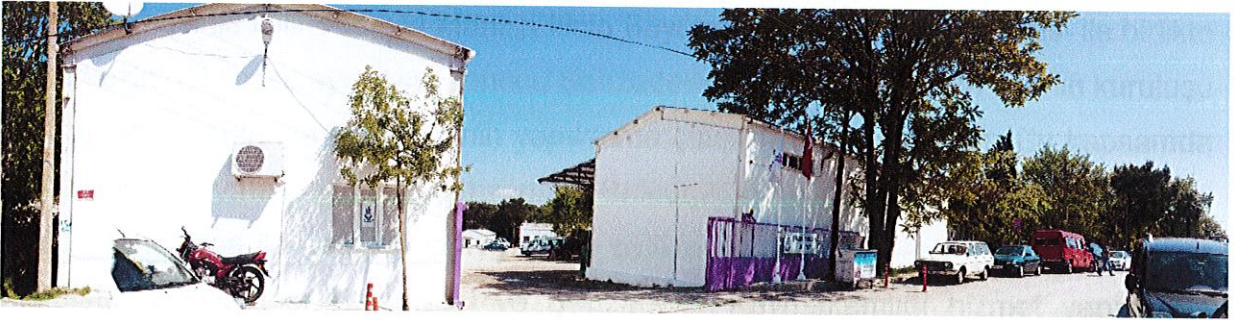
1513 sokaktan alanın görünümü