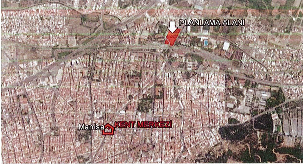
Planlama Alanının Kent İçindeki Konumu

Plan değişikliğine konu olan taşınmazlar Manisa İli, Şehzadeler İlçesi, 2.Anafartalar Mahallesi sınırları içerisinde bulunmaktadır. Kent merkezinin kuzeydoğusunda yer alan taşınmazların bulunduğu bölgeyi güneyde 1513.sokak, doğuda Akhisar Caddesi, kuzeyde 1521. Sokak, batıda ise Tarım İl Müdürlüğü arazisi çevrelemektedir.